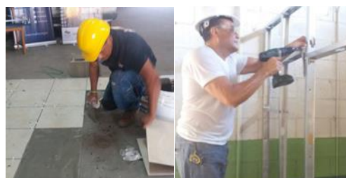
Proceso de evaluación de competencias laborales de los Migrantes Retornados.