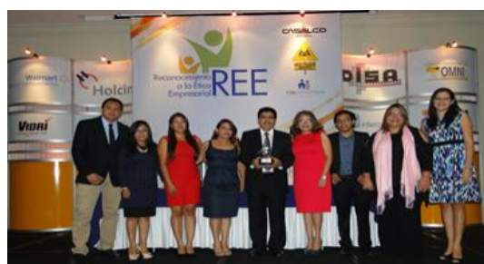
Ganador año 2016 Plycem Construsistemas

Para seleccionar a la empresa ganadora, se realiza un proceso por parte de un comité evaluador, donde se valoran las buenas prácticas realizadas por estas empresas y el cumplimiento realizado en las siete materias de responsabilidad social, según la ISO 26000.