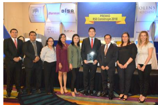
Categoría Mediana empresa Empresa: Blokitubos, S.A. de C.V. Buena práctica: Bloki Voluntario

Se entregó el Premio RSE Construye, en su primera edición, a dos empresas agremiadas.