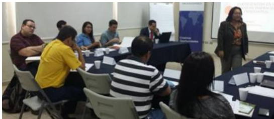
Capacitación a 11 empleados de empresas del sector construcción y de instituciones de gobierno para certificarse como Evaluadores de Competencias para el Sector Construcción.