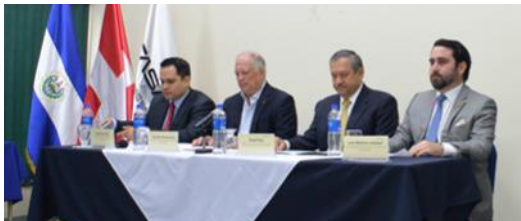
Convenio de cooperación interinstitucional para certificar las competencias laborales de migrantes que han ganado experiencia laboral dentro del sector construcción en el país norteamericano.

Acciones que se llevaron a cabo durante esta primera fase fueron: