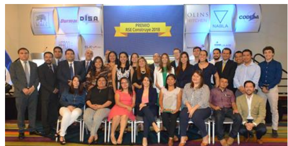
Categoría Gran empresa Empresa: Inversiones Bolívar, S.A. de C.V. Nuestra cultura de libertad con responsabilidad