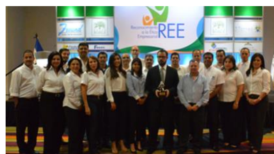
Ganador año 2017 Mexichem El Salvador /Amanco