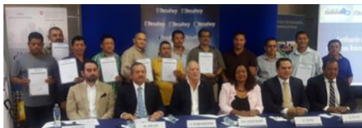
Certificación de 14 migrantes retornados en las áreas en que demostraron habilidad técnica: ● Instalación de Sistemas de placas de yeso ● Instalación en Recubrimiento Cerámico)